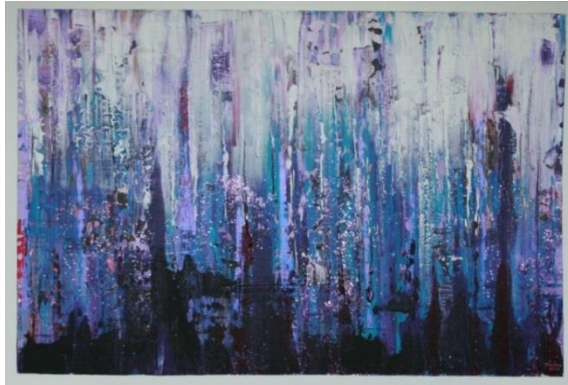
werk van Annelies Haan

door de natte straten van het avondlicht klinkt het hooggehakte tikken van hete pumps, een grabbel- lijf, met lokkend stemmetje, dat om aandacht geilt; De sirene- zang 'Quinta Feira' of het nonchalant fluiten, door duizend- en -een nacht in 'Strada' aangeland, als een krolse kater, voorbij de waarheid van morgen. Nog spring ik hier touwtje rond een vangnet van plezier.